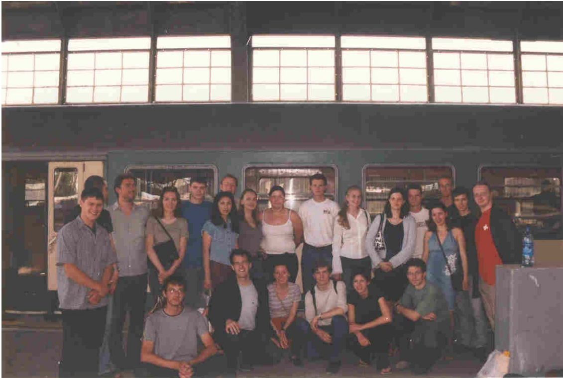
Abschied in Kaliningrad

Am 7. Tage hieß es bereits, Abschied zu nehmen.