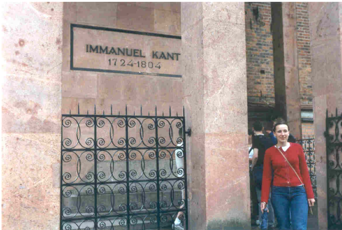
Unser ständiger Begleiter – Das Grabmal von Immanuel Kant in Königsberg

Den Abend ließen dann die meisten von uns bei Musik und Tanz in der auf dem Heimweg von der Stiftung zum Studentenwohnheim gelegenen Wochendisko in den Befestigungsanlagen der Stadt ausklingen.