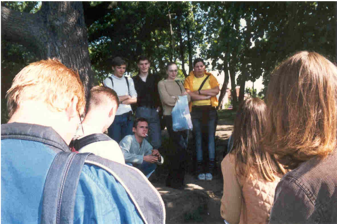
Workshop im Freien

Der Abend klang bei einem Konzertbesuch mit der russischen Rockgruppe SPLIN aus.