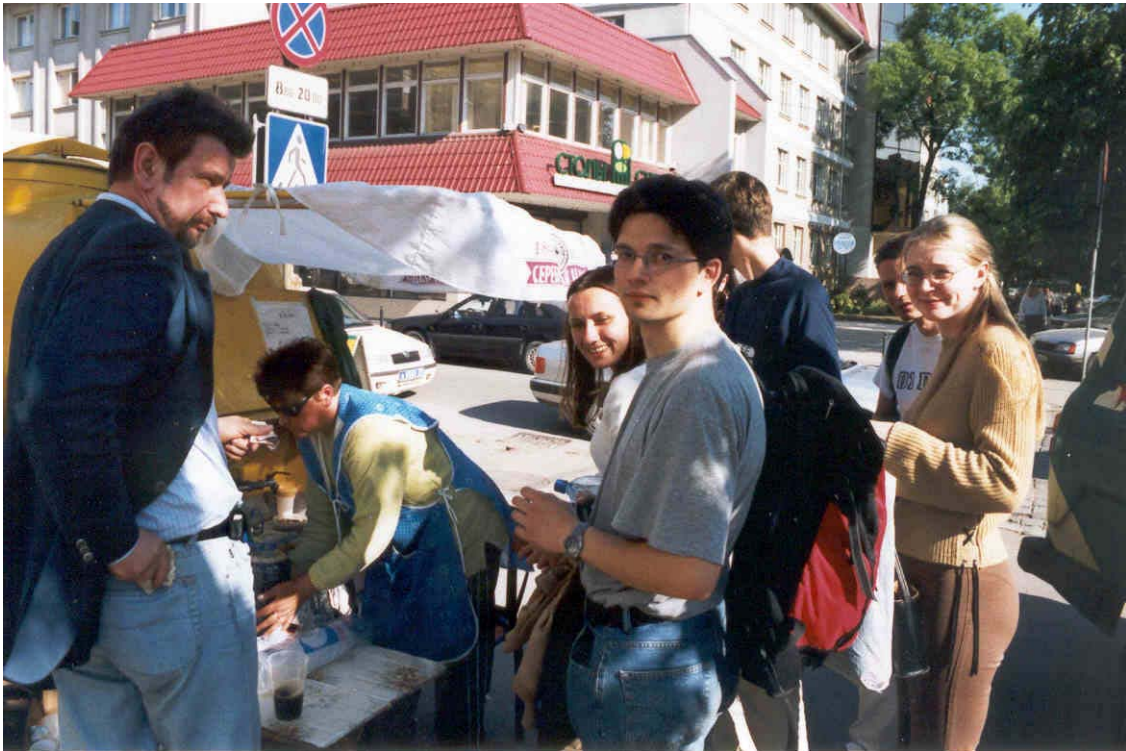
Deutsche und Russische Studenten beim Kwas trinken!

Tourismus, insbesondere auf Gäste aus Moskau. Die Bedeutung des Militärs, auch in dieser Stadt, die viele Militärsanatorien beherbergt, nimmt sehr stark ab. Am Abend trafen wir noch einmal mit den Angestellten und Freiwilligen des Sozialzentrums Svetlogorsk zusammen und diskutierten lebhaft mögliche Maßnahmen zur Beseitigung sozialer Ungerechtigkeiten in beiden Ländern.