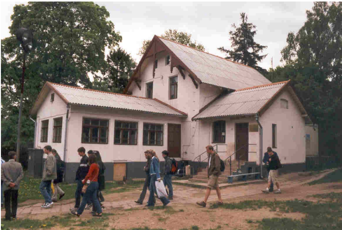
Das Tuberkulose-Zentrum in Svetlogorsk/Rauschen

Am zweiten Tag in Kaliningrad, der ganz unter dem Thema "Sozialarbeit in Kaliningrad" stand, besuchten wir ein Sozialzentrum und ein Tuberkuloseheim für Kinder in Svetlogorsk. Neben allgemeineren Referaten der russischen Teilnehmer zu den großen sozialen Problemen im Gebiet Aids, Drogen und Arbeitslosigkeit, berichteten die jeweiligen Leiter dieser Sozialeinrichtungen über ihre Aufgaben. Später konnten wir uns vor Ort ein Bild über deren praktische Umsetzung machen. Hierbei zeigte sich sehr deutlich, dass sich der russische Staat fast vollständig aus der Betreuung von Bedürftigen zurückgezogen hat. Wie uns die russischen Teilnehmer berichteten, werden die meisten Leistungen privat getragen, aber auch Spenden aus Deutschland stellen einen großen Finanzierungsanteil für diese Einrichtungen dar. Allerdings, und so erschloss sich auch für uns die Situation, sei dies alles nur ein Tropfen auf den heißen Stein. Von einer ernsthaften Bekämpfung von Tuberkulose und anderen gefährliche Krankheiten kann in keinem Fall die Rede sein.