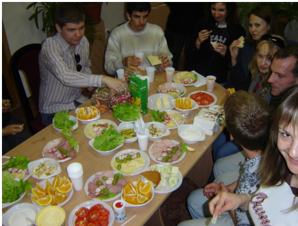
Russisch-polnisch-deutsches Beisammensein am Abend

Am Ende des Tages gab es noch einen lustigen Kennenlernabend in gemütlicher Runde, bei der wir uns gegenseitig in polnischer, russischer und deutscher Sprache vorstellten und kleine Interviews mit jeweils einem Partner aus dem Ausland führten. Bei den Vorbereitungen für unsere Abendbrot halfen alle fleißig mit und der Tisch war schnell bunt gedeckt.