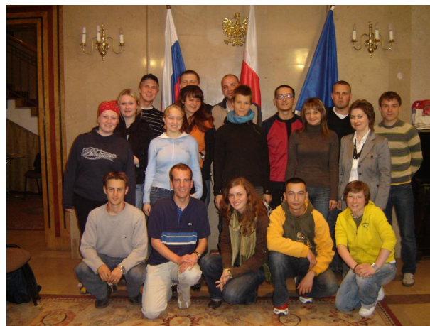
Im polnischen Generalkonsulat

Nach einer kurzen Wartezeit wurden wir in einen großen Saal gebeten, wo uns die Beauftragte für kulturelle Angelegenheiten des Konsulats empfing. In einer kurzen Einführung ging sie vor allem auf die Aufgaben des Konsulats im Allgemeinen ein, wie den Schutz und die Vertretung polnischer Bürger im Ausland, Visumausstellung für russische Staatsbürger und die Konzentration auf administrative Aufgaben.