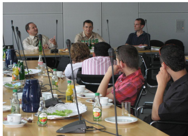
Diskussionsrunde in der FDP-Landtagsfraktion