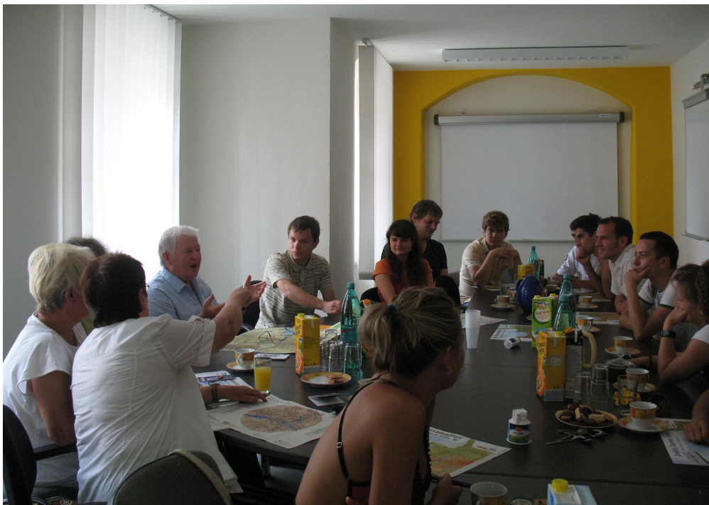
Russen, Polen und Deutsche im generationsübergreifenden Gespräch