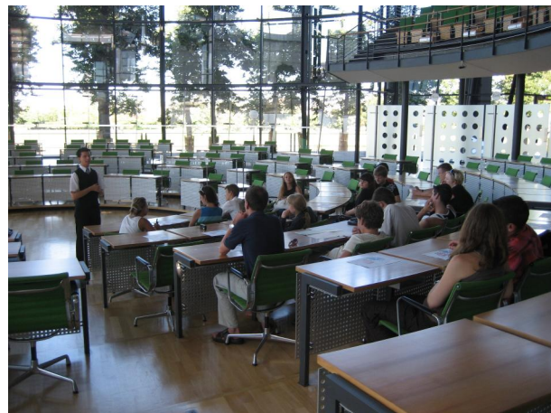
Im Plenum des Sächsischen Landtages

Dieser erste Tag hat viele neue verschiedene Erlebnisse, der Weg bis Dresden und dann das Programm bis zum Abend, danach waren wir schon etwas müde, aber dieser Tag war sehr interessant.