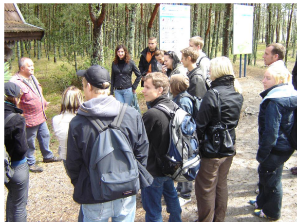
Ornithologische Station Rybachy

Von 3 Kleinbussen wurden wir vom Grammer-Werk abgeholt und fuhren Richtung Nationalpark Kurische Nehrung. Es regnete immer noch und wir befürchteten, dass Naturerlebnis würde durch das schlechte Wetter getrübt. Glücklicherweise klarte es aber auf und für den Rest des Tages hatten wir Sonnenschein und blauen Himmel. Am Eingang des Nationalparks bezahlten wir unseren Eintritt, der für russische Verhältnisse hoch schien. Doch erklärte unser Seminarleiter uns, dass es Ziel sei, durch die hohen Preise Massentourismus zu vermeiden und die Natur so zu schonen.